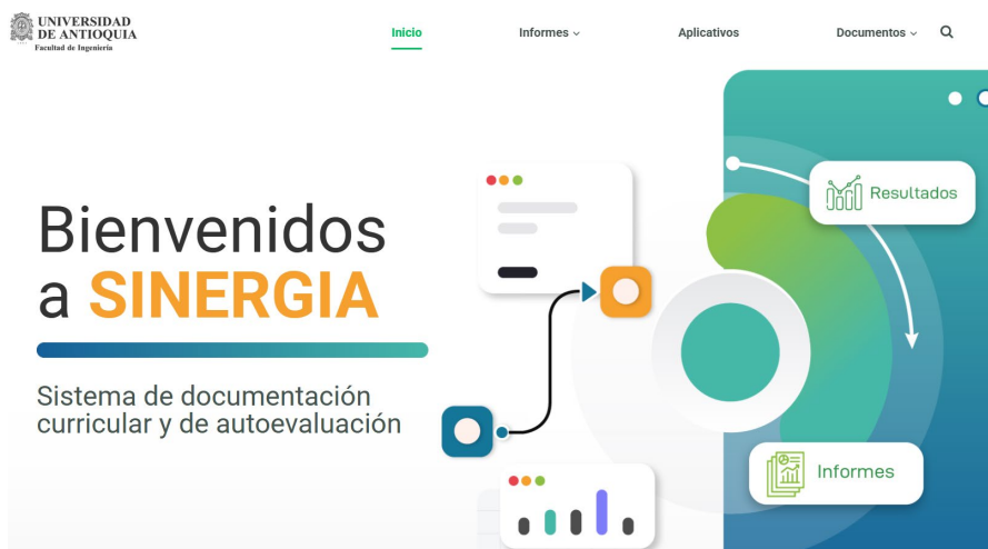
Figura 6. Interfaz principal del aplicativo SINERGIA: https://sicingeneria.udea.edu.co/

Por último, con el fin de alojar la información relacionada con el proceso de mejoramiento continuo, se instauró el aplicativo SINERGIA (Figura 6: https://sicingeneria.udea.edu.co/ ) el cual es el sistema de documentación curricular y de autoevaluación de la Facultad de Ingeniería. En este aplicativo, se alojan los acuerdos de Facultad definidos hasta el momento (resultados de aprendizaje, indicadores de desempeño), asimismo se alojarán los objetivos educacionales del programa, mapas curriculares, entre otras informaciones referentes al proceso de calidad en la Facultad.