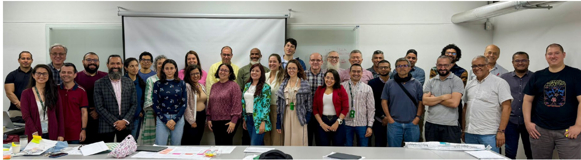
Figura 1. Taller de mejoramiento continuo con los docentes de la Facultad

En esta etapa se implementaron talleres con los docentes de la Facultad (Figura 1), con el fin de construir mapas curriculares que permitieran identificar los cursos para medir los resultados de aprendizaje, definiendo a su vez el nivel o dominio de aprendizaje de los estudiantes: formativo introductorio, formativo de refuerzo y sumativo (ABET, 2023). A medida de ejemplo se presenta en la Figura 2 el mapa curricular del programa de Ingeniería civil.