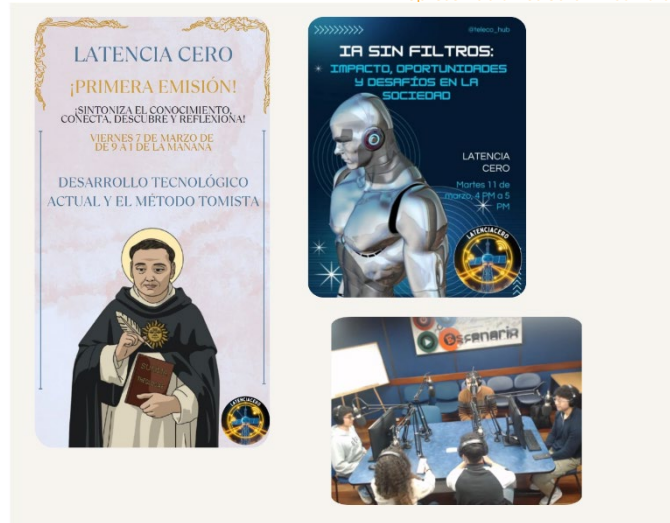
Figura 1. Evidencia del programa radial latencia cero.