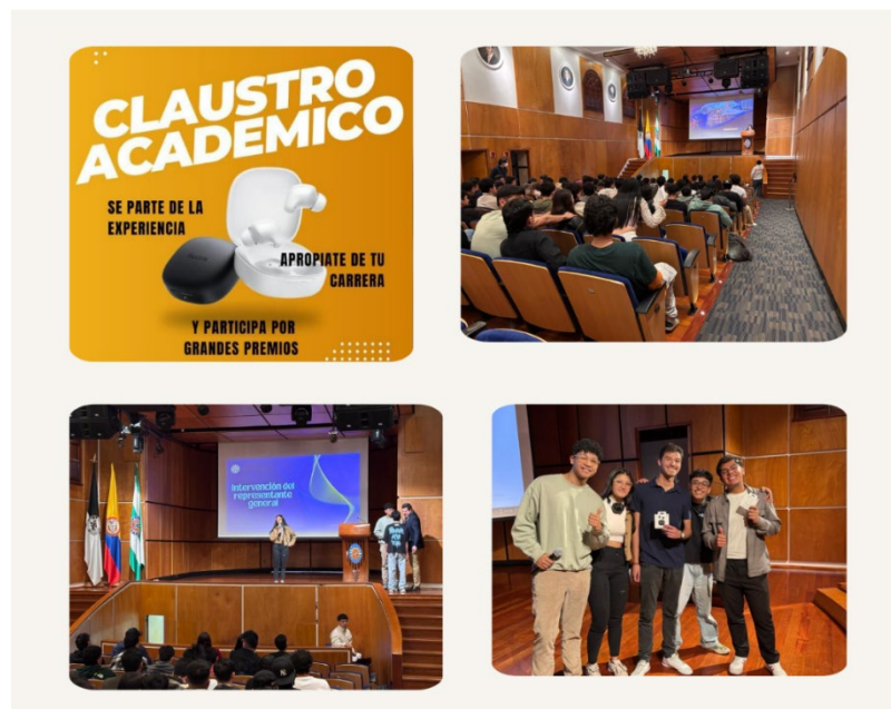
Figura 2. Evidencia Claustro Estudiantil

El evento dio inicio con un protocolo institucional que incluyó la entonación de himnos y discursos por parte de las autoridades académicas. Posteriormente, se desarrollaron dinámicas como el video interactivo "Ping Pong" con docentes, testimonios de estudiantes en el extranjero y el concurso "¿Quién quiere ser ingeniero?". Esta mezcla de formalidad y entretenimiento logró una alta participación, ofreciendo una experiencia valiosa y gratificante para los estudiantes. De esta manera, en la Figura 2 se muestra el desarrollo del evento en diversos momentos destacados, como las intervenciones de la representante, la participación del público en el concurso y la entrega de premios.