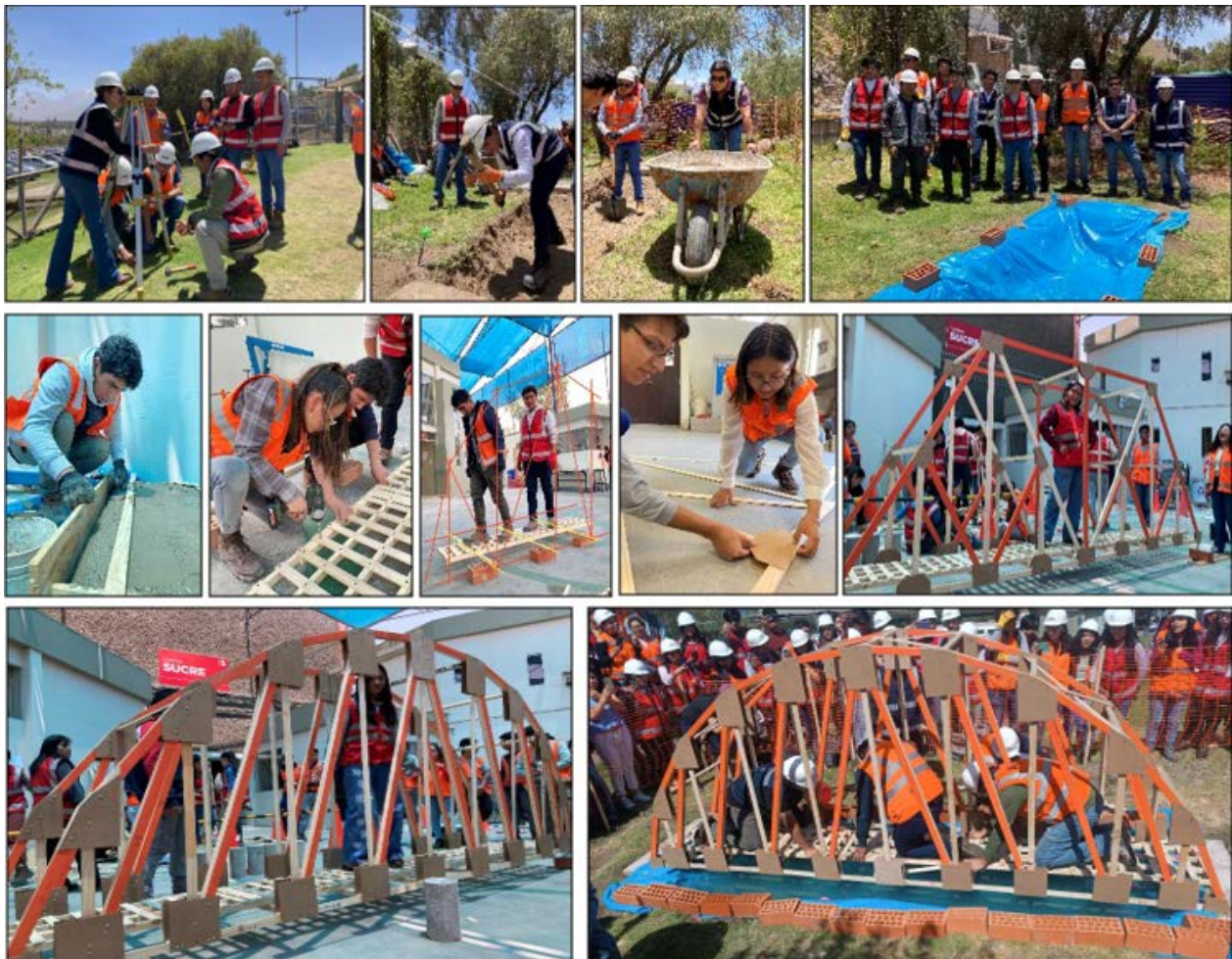
Ilustración 3. Entregables Equipos de Construcción. Expediente PIP

Los formatos de rúbrica aplicados con formularios de Google, y los resultados de las evaluaciones forman parte del expediente del proyecto y permitieron establecer las calificaciones grupal e individual a cada participante del PIP.