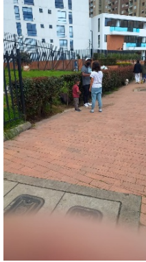
Imagen 3. 1 menor y 2 adultos a la entrada del sector residencial de Potosí.