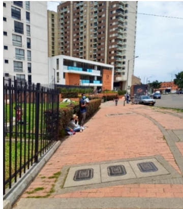
Imagen 8. 2 adultos y un niño venden dulces a la entrada del sector residencial de Pontevedra.