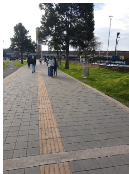
Imagen 10. Una mujer y un niño venden dulces a la salida de la terminal terrestre de transporte del salitre.