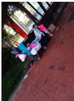
Imagen 6. 1 mujer y una niña vendiendo bolsas de la basura en la entrada del sector comercial de Potosí.