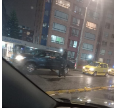
Imagen 7. Un hombre y un niño venden dulces a la salida del McDonald's de la Avenida La Esperanza.