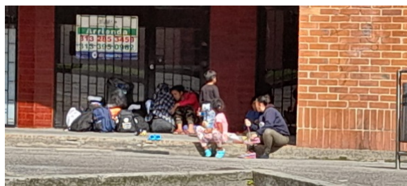
Imagen 9. 2 adultos y 4 niños se encuentran descansando a la entrada del sector residencial de Carlos Lleras