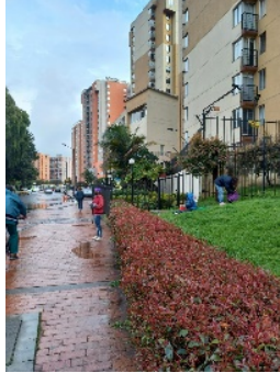
Imagen 1. 2 mujeres y 2 niños en la entrada del sector residencial de Potosí