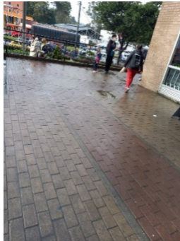
Imagen 2. 1 menor y un adulto vendiendo bolsas de la basura a la entrada del sector comercial de Potosí